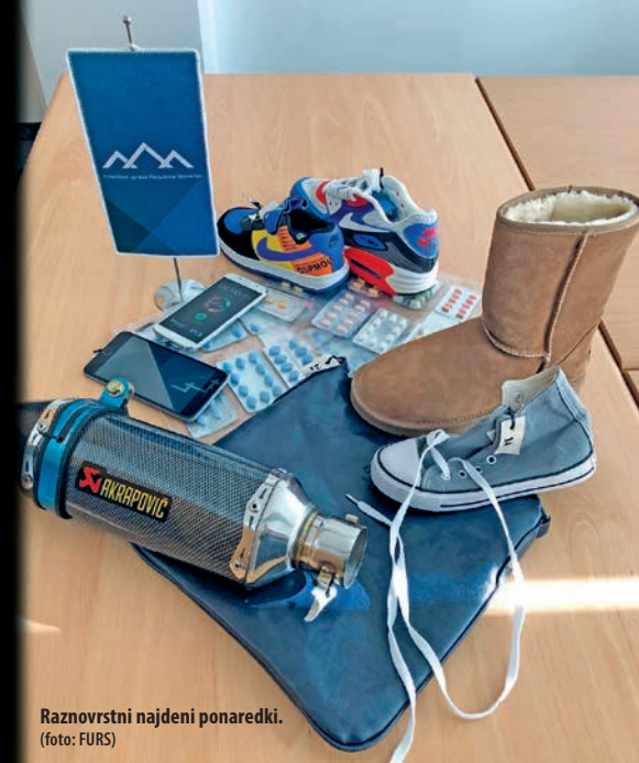
Raznovrstni najdeni ponaredki.

V Sloveniji Finančna uprava RS vsako leto odkrije in začasno zadrži več kot milijon izdelkov. Vrednost tega blaga znaša več milijonov evrov. Največ je zadržane obutve in oblačil, modnih dodatkov ter kozmetičnih izdelkov. Količinsko se največ blaga zadrži v koprskem pristanišču, največ posameznih pošiljk pa v Ljubljani, kjer nadzirajo poštno pošiljke, ki prihajajo iz držav zunaj Evropske unije.